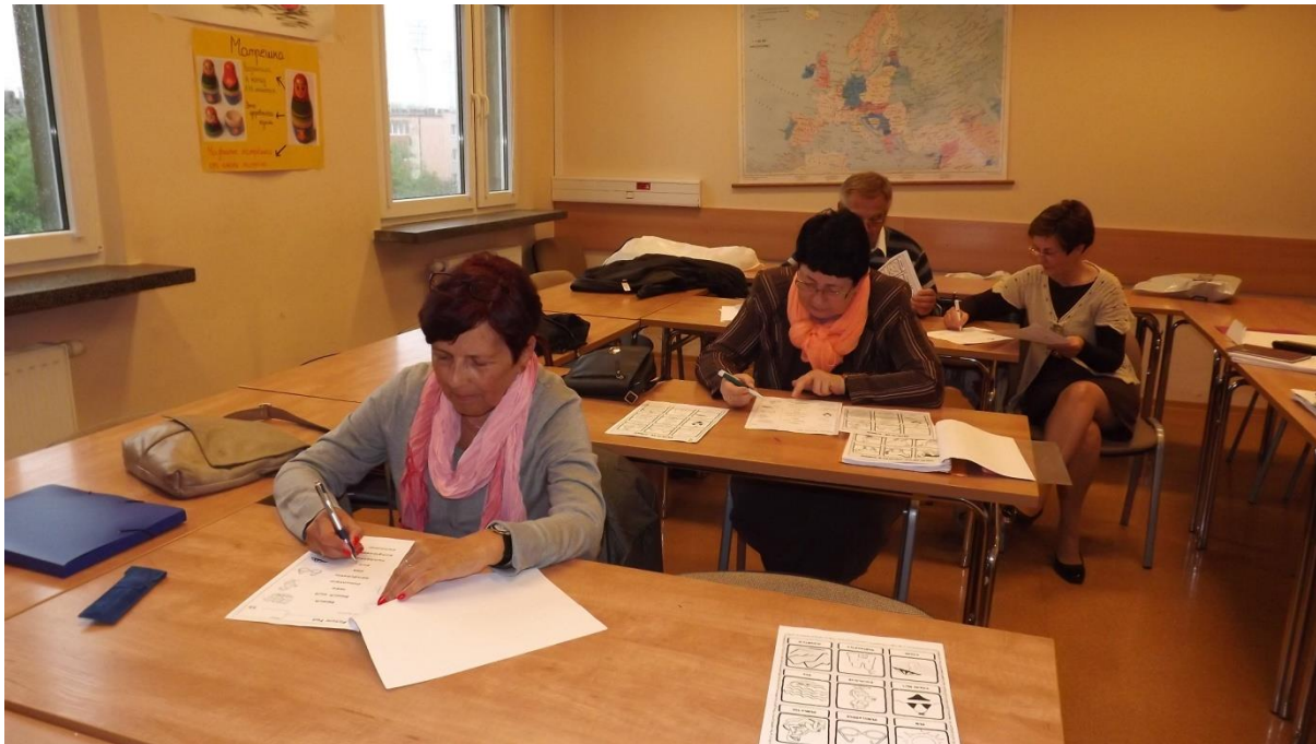
Zdjęcie nr 7. Seniorzy na lekcji pt: „Holiday”.