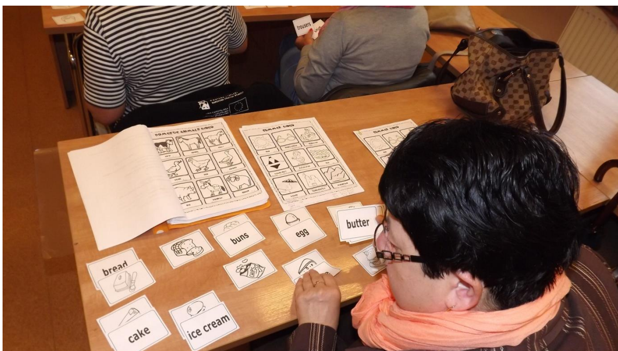
Zdjęcie nr 10. Seniorzy poznają słownictwo z tematu: jedzenie.