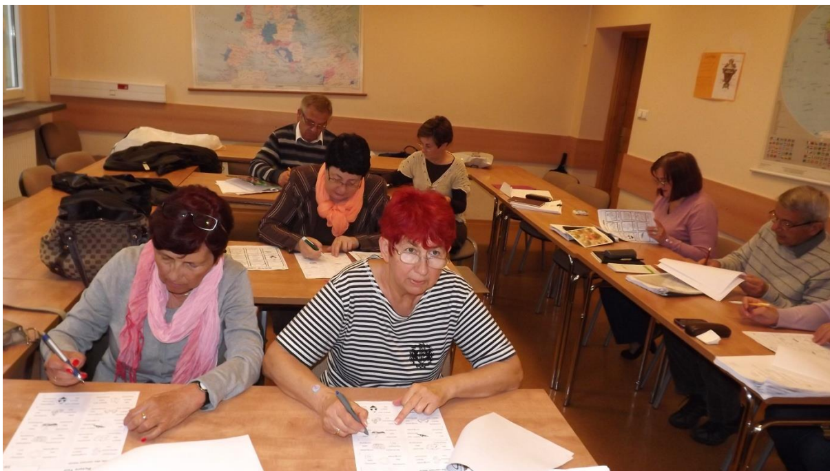
Zdjęcie nr 8. Rozwiązywanie zadań.