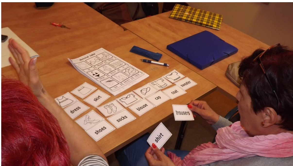
Zdjęcie nr 9. Seniorzy poznają nazwy ubrań w języku angielskim.