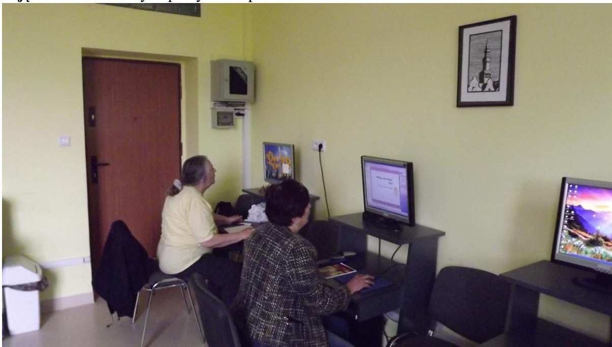
Zdjęcie nr 5. Seniorzy w pracy z komputerem.