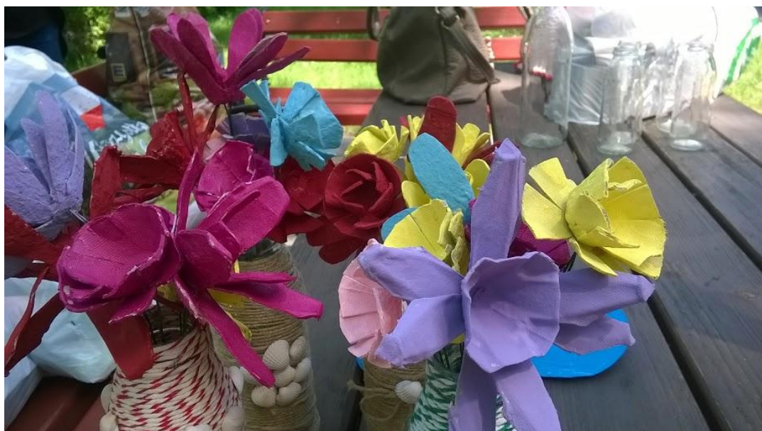
Zdjęcie 26. Efekt końcowy warsztatu

pomysłów, w których wykorzystali stare, plastikowe butelki, gazety, rolki po papierze oraz ubrania. Powstało wiele ciekawych przedmiotów nadających się zarówno na prezent, jak i do codziennego użytku.